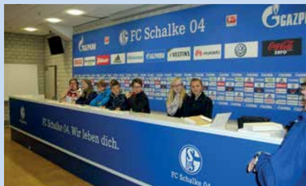
Die Teilnehmer der Exkursion in die Veltins-Arena halten eine konspirative Pressekonferenz ab.

Ein Fußball-Stadion, welches gleichzeitig Ort von so verschiedenen Veranstaltungen wie Biathlon-Wettkämpfen, Großkonzerten und Eishockey-Weltmeisterschaften ist, ist ein echtes Hightech-Unternehmen.