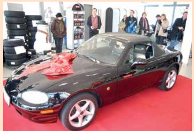
So schick sah das letzte Cabriolet aus, welches die JCC versteigert hat.

Genauere Informationen hierzu wird es bald auf unserer Homepage, Elternbrief und Presse geben.