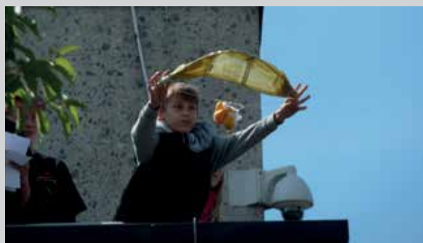
Phantasievolle Flugobjekte starteten vom Balkon der Stadtwerke-Kantine und versuchten ihren zerbrechlichen Passagier heil zum Boden zu bringen.

Die 12. Ausgabe von Alberts Enkel griff ganz weit zurück zu den Anfängen. 2004 bei der ersten Ausgabe von Alberts Enkel lautete die Aufgabe schon einmal ganz ähnlich: Baut aus den vorgegebenen Materialien eine Vorrichtung, in der ein rohes Ei einen Sturz aus dem zweiten Stock schadlos übersteht. Die Veranstaltung fand zum fünften Mal in Zusammenarbeit mit den Stadtwerken Bochum statt und zwar am 17. Juni 2015 auf dem Betriebshof der Stadtwerke Bochum in Hamme. Gewinner wurde ein Team der Anne-Frank-Realschule. Den Konstrukteuren gelang es das Ei nach einem Flug von 9 Metern Weite und einer Flugzeit von 3,9 Sekunden sicher zu landen.